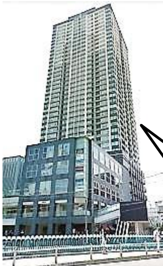
ファーストプレイス横浜 (万里橋からの眺望)