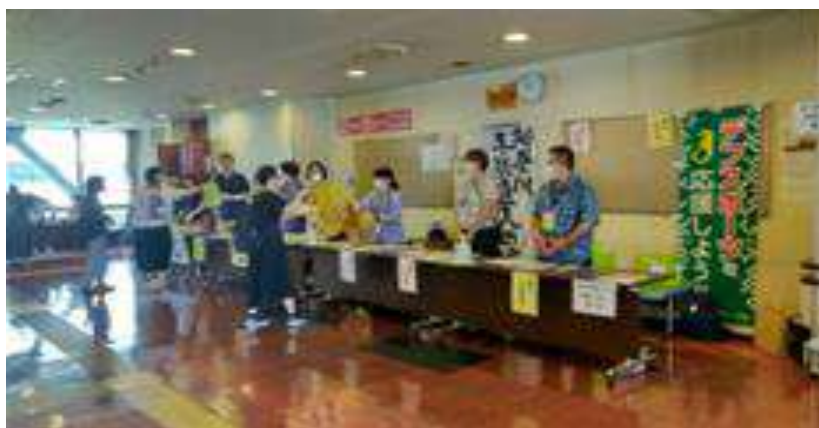
(写真・昨年の神通研集会から)

参加資格： 神聴連会員・神通研会員・中失難聴団体会員・ゆりの会会員 一般の方・当日券の方は第1分科会「入門ゼミナール」のみ 参加できます(注:会員であっても当日申込みは一般となります)