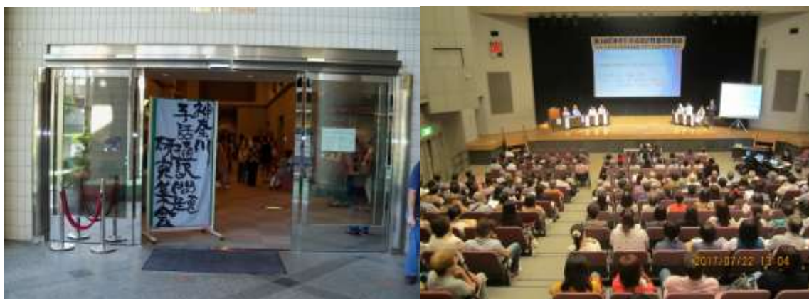
(写真・昨年の神通研集会から)

参加資格： 神聴連会員、神通研会員、中失難聴団体会員、ゆりの会会員 一般の方、当日券の方は第1分科会「入門ゼミナール」のみ 参加できます。 (注：会員であっても当日申し込みは一般となります)