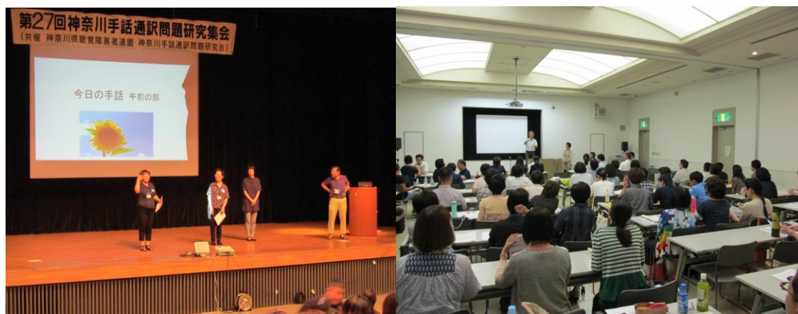
(写真・昨年の神通研集会から)

参加資格： 神聴連会員、神通研会員、中失難聴団体会員、ゆりの会会員 一般の方、当日券の方は第4分科会「入門ゼミナール」のみ 参加できます。 (注：会員であっても当日申し込みは一般となります)